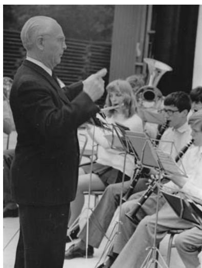
Lipník n/B 1976