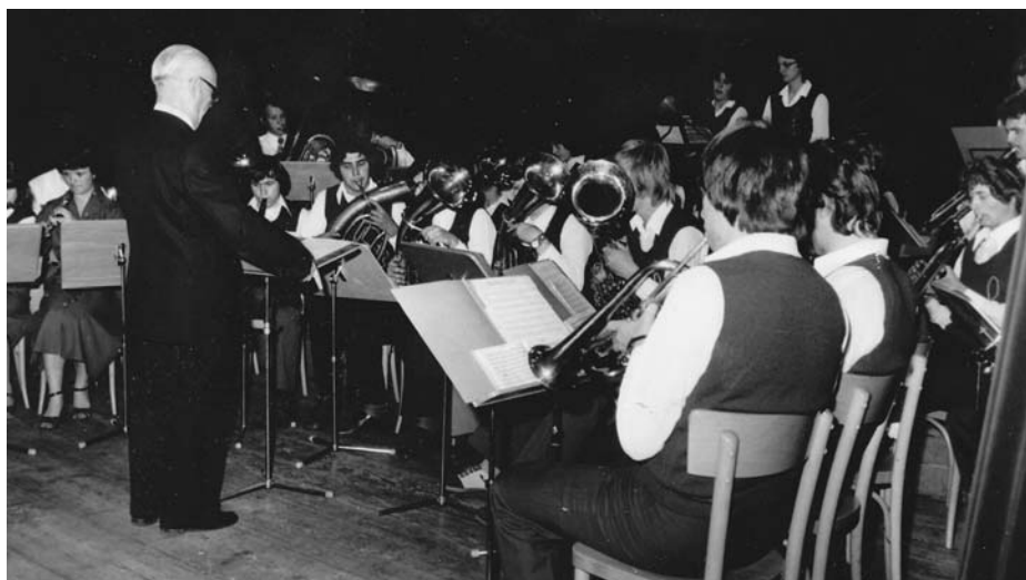
Přehlídka dětských dechových hudeb