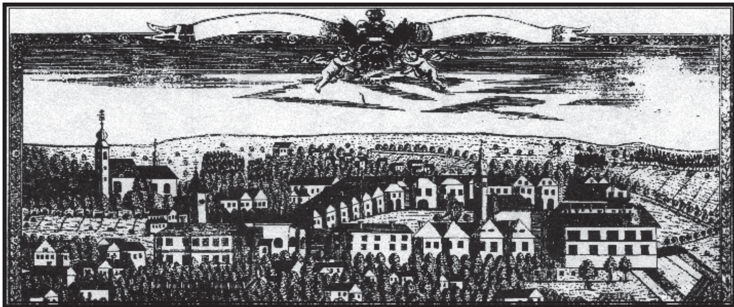
Pohled na město Potštát z r. 1826. Přetiskla z měděné matrice Dílna umělecké grafiky v Novém Jičíně

Základní umělecká škola Potštát a Sdružení rodičů a přátel školy při ZUŠ Potštát