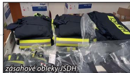
zásahové obleky JSDH