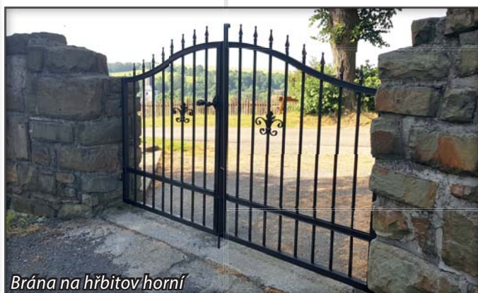
Brána na hřbitov horní