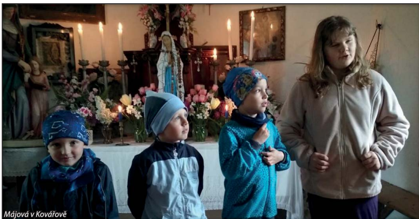
Májová v Kovářově

DUCHOVNÍ SPRÁVCE (ADMINISTRÁTOR FARNOSTI POTŠTÁT) SÍDLÍ NA FAŘE V DRAHOTUŠÍCH, KDE JEJ V PŘÍPADĚ POTŘEBY MŮŽETE NAVŠTÍVIT.