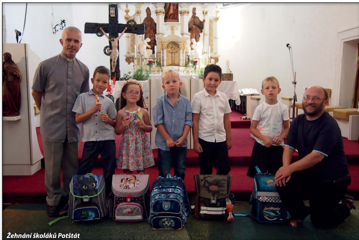
Žehnání školáků Potštát

Adresa webu je: www.farnostdrahotuse.cz a dostanete se k němu i přes web Potštátu. Kromě aktuálního dění ve farnostech Drahotuše, Partutovice a Potštát na něm naleznete i fotografie a historii farnosti.