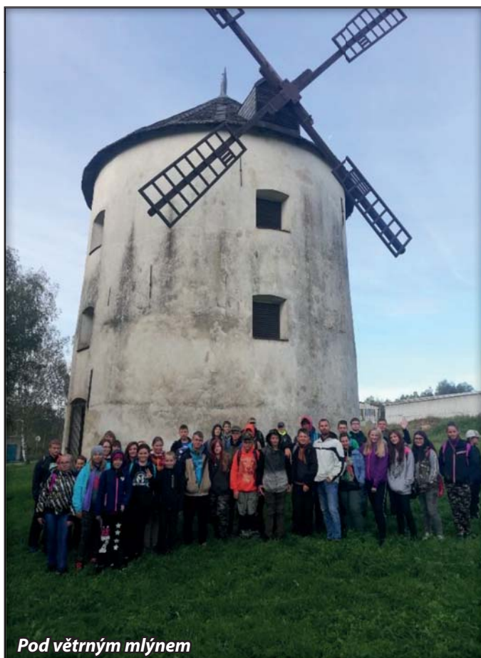
Pod větrným mlýnem