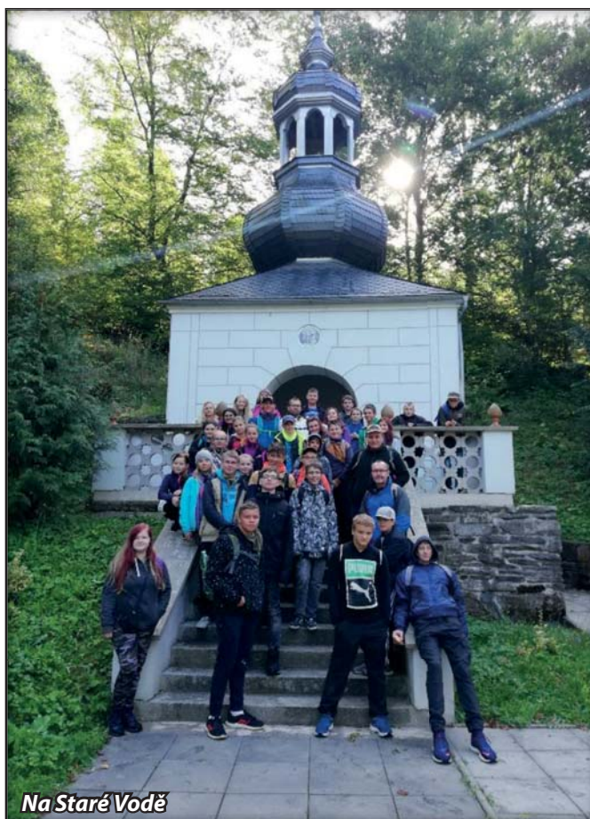
Na Staré Vodě