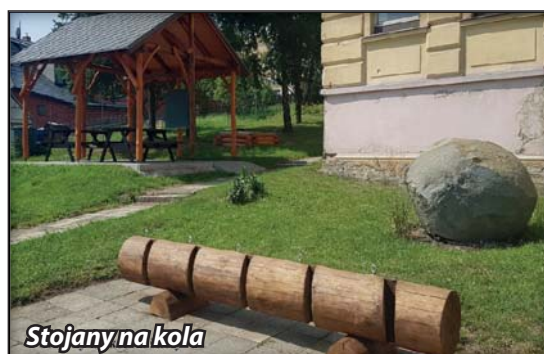
Stojany na kola