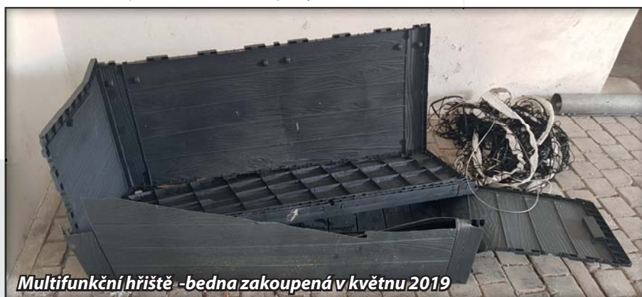
Multifunkční hřiště - bedna zakoupená v květnu 2019