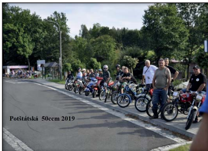
Potštátská 50ccm 2019